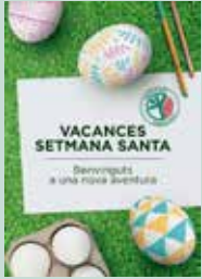
VACANCES DE SETMANA SANTA 26/3 - 2/4