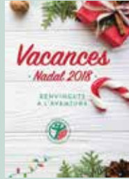
VACANCES DE NADAL 21/12 - 4/1