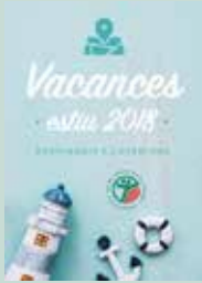
VACANCES D'ESTIU 19/7 - 31/8